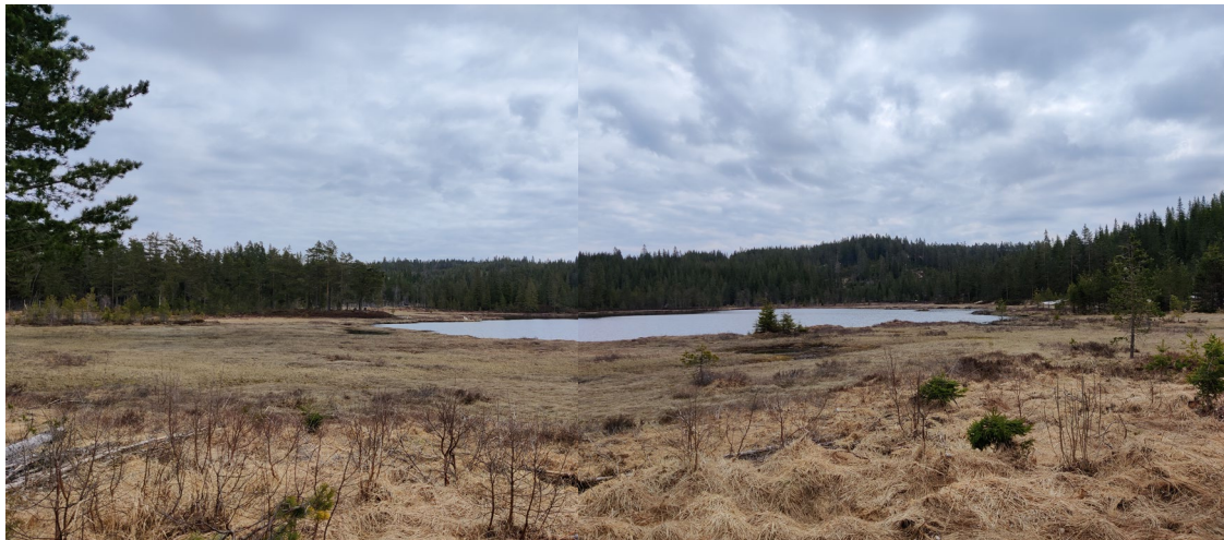
Bilde 3 Skulehustjørna sett fra vest og grusveien. På motsatt side av tjønna foreslås det naturopplevelse for bobilreisende.

Vi vurderer at planen ikke utløser krav om planprogram, jf. § 6. Vi vurderer at planen ikke utløser krav om konsekvensutredning, jf. § 8.