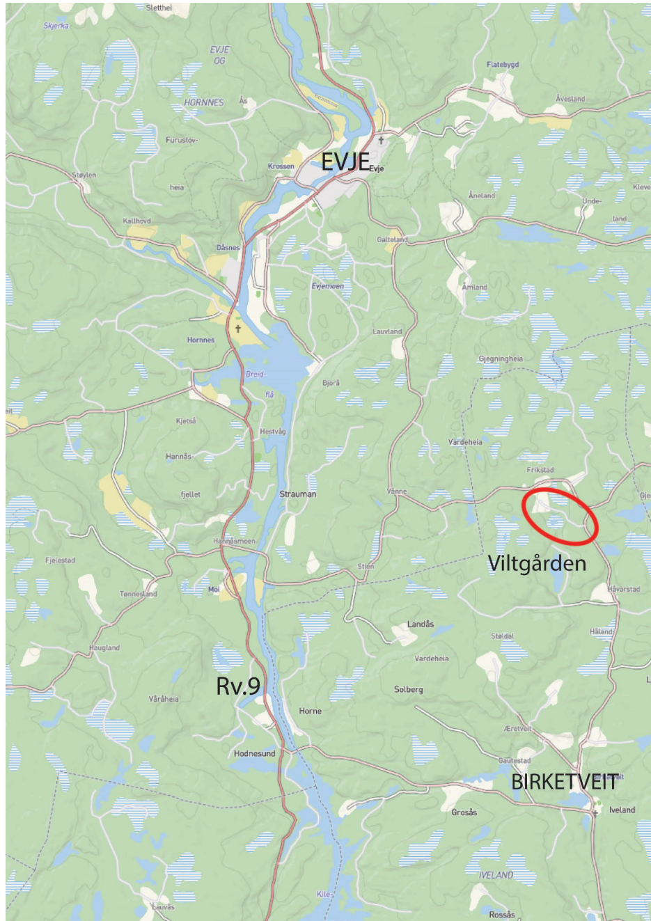
Bilde 1 Oversikt som viser plassering av Viltgården

Viltgården skal utvikles videre nord for Birketveit. Området skal utvikles som turistattraksjon med fokus på naturopplevelser. Området skal inneholde innhegning for elg tilrettelagt for besøkende samt besøkscenter samt anlegg for parkering og gangtrafikk i området. Atkomstveien er i dag brukt som atkomstvei til dagens Viltgården, samt omkringliggende gårds- og boligbebyggelse.