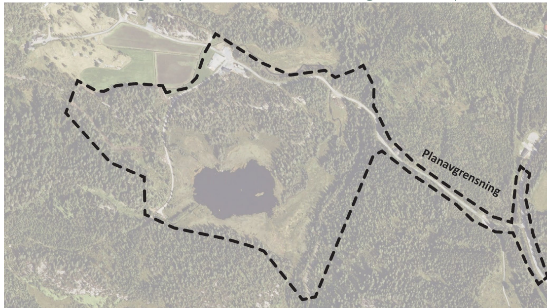
Bilde 2 Forslag til planavgrensning (Over: flyfoto som bakgrunn / Under: grunnkart som bakgrunn).